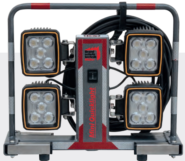
• Art.-Nr. 250063 Quicklight LEDmini.

Mit der Umschaltfunktion zwischen Netz und Akkubetrieb ist das Quicklight LEDmini sofort einsatzbereit - flexibel durch unbegrenzten Aktionsradius und bei unterschiedlichen Stromquellen einsetzbar. Das Quicklight LEDmini steht auf vier ausklappbaren Füßen - für hohe Standfestigkeit. Durch die integrierte Aufnahmhülse passt das Quicklight LEDmini auf jedes Stativ.